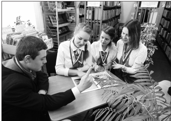
Девочки, я думаю, нашел ответ!

Почитаемые во все времена, интеллектуальные игры сегодня стали как никогда актуальны и востребованы. Их популяризируют органы власти, образования, средства массовой информации, поскольку и в ходе, и по результатам таких состязаний выявляются лучшие из лучших, коммуникабельные, одаренные юноши