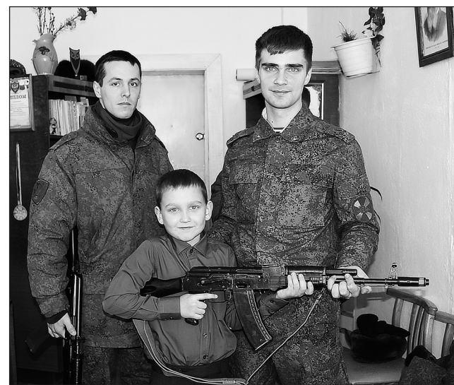
Служить России суждено тебе и мне...

беззаветного служения Родине, постоянной готовности к ее защите.