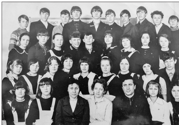
Выпускники 1975-76 годов